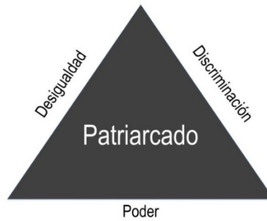
Gráfico 1. Ejes definatorios de la violencia de género